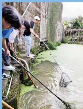
井泉の掃除をする生徒たち