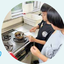
ハーブサークル クラフトコーラ作り

今年度もサークルの方々や地域の方に協力をいただき、子どもたちの夏休み企画を実施することができました。子どもたちの笑顔があふれる素敵な時間になりました。