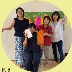
笑いヨガサークルのみなさんと

『公民館のしあさって』を読み知った繁多川公民館。実習はここがいい！と思い、ワクワクしながら初めて沖縄に向かいました。そこから1週間。ペタンク、笑いヨガ、まーい、プレーパークなど、沢山の活動に参加させていただきました。公民館にいれば多世代の方に出会い、話を聞くとその方が「すぐりむん」だと分かる。イベントでは、中高生の「お助け隊」が小学生をサポートする姿もありました。地域に暮らす一人一人の「好き」「得意」「やってみたい」「役に立ちたい」という思い、そしてそれを引き出す職員さん、みんなでこの公民館を形づくっている。自治のあり方への学びと、地元のような温かさを抱えて東京に戻ってきました。ありがとうございました！